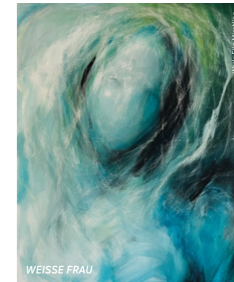
Werte: Elke Mischling

durch einen tatsächlichen oder vermeintlichen Tabubruch im Gedächtnis des Landes haften geblieben sind und die Fantasien der Menschen bis zum heutigen Tag beschäftigen.